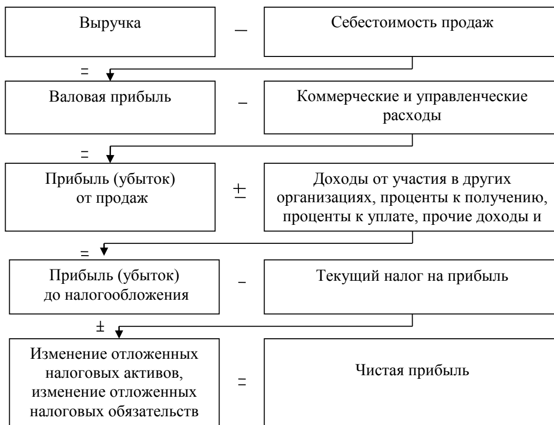
Рисунок 1 - Модель хозяйственного механизма организации, основанная на формировании прибыли [7, С. 89]