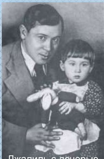
Джалиль с дочерью

Предвоенные годы отмечены в творчестве Джалиля усилившейся тягой к эпической широте изображения. В это время им создано несколько крупных эпических поэм. Очень интересна не опубликованная при жизни автора поэма «Директор и солнце» (1935). Своеобразны по характеру и стилистическому рисунку поэмы «Джиган» (1935-1938) и «Письмоносец» (1938).