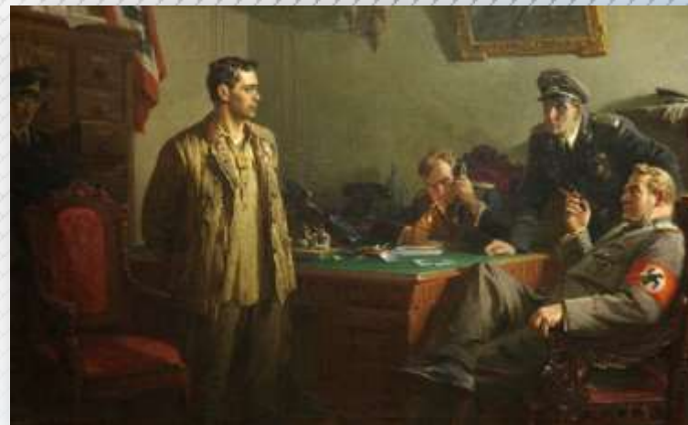
Якупов Х.А. "Перед приговором"

Узнав, что Муса Гумеров (так назвал себя в плену Муса Джалиль) - известный поэт, немцы включили его в состав комитета. Джалиль, согласившись, стал сколачивать подпольную группу, задачей которой стала противостояние планам гитлеровцев.