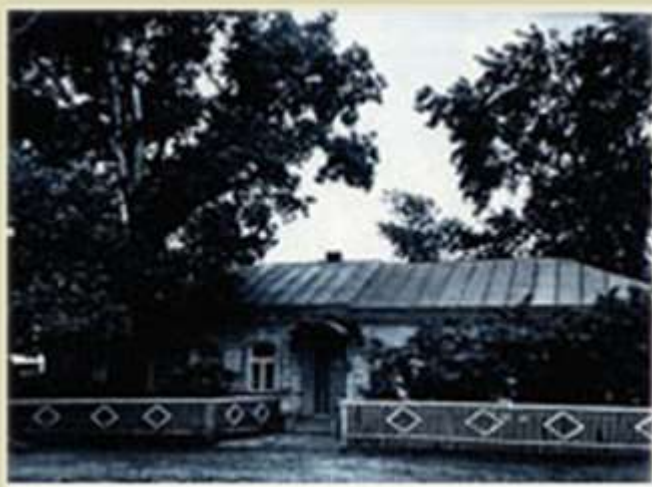
Дом, в котором вырос К.В. Иванов