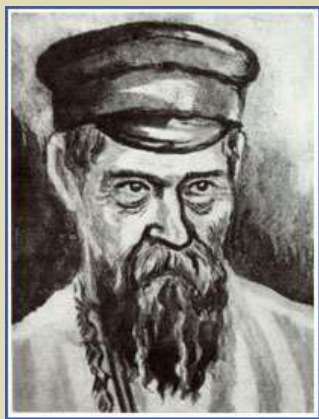
Портрет старого чуваша. Приписывается К.В. Иванову