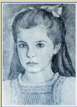
Девочка (внучка И.Я. Яковлева?) Рисунок К.В. Иванова.

В становлении личности Константина Иванова значительную роль сыграла его тяга к живописи — он даже готовился поступить в Академию художеств. Помимо этого, он профессионально овладевает фотографическим мастерством — на его снимках запечатлены многие эпизоды из симбирского периода жизни.