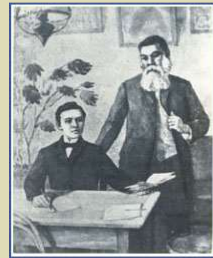
И.Я. Яковлев с К.В. Ивановым

Позже, когда «затишают страсти», Иван Яковлевич Яковлев привлекает Иванова для работы в комиссии по переводу и изданию книг на чувашском языке. Константин Васильевич переводит стихотворения М. Ю. Лермонтова «Узник», «Волны и люди», «Парус», «Горные вершины», «Утёс», «Чаша жизни» и др., много сил отдаёт чувашскому переложению «Песни про царя Ивана Васильевича, молодого опричника и удалого купца Калашникова». Им же переведены тогда отрывки из произведений Н. П. Огарёва, А. В. Кольцова, Н. А. Некрасова, а также отдельные стихи А. Н. Майкова, К. Д. Бальмонта.