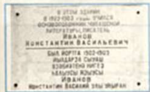
Здание Белебейского городского училища, где учился К.В. Иванов

Дошкольные годы Кэстюк большей частью проводил у бабушки в соседней деревне Кайраклы, а восьмилетним мальчиком был отдан в сельскую начальную школу, которую закончил в 1902 году. Затем учился в Белебеевском городском училище , по окончании которого отец устроил его в подготовительный класс Симбирской чувашской учительской («яковлевской») школы. Здесь за два года мальчик полюбил столярное дело, подолгу не выходил из школьной мастерской, занимаясь резьбой по дереву, а также живописью. Эту любовь к творчеству Иванов пронес через всю свою недолгую жизнь. Известно, что он собственными руками смастерил из дерева пишущую машинку, сам же делал столы и шкафы, другую нехитрую мебель, а также писал портреты и оформлял декорации к спектаклям.