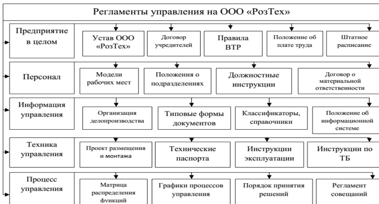
Рисунок 3 – Пример регламентов управления в ООО «РозТех»