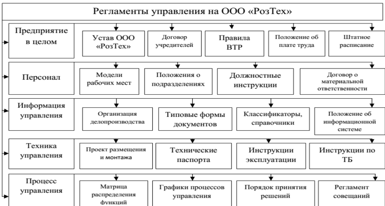
Рисунок 3 – Пример регламентов управления в ООО «РозТех»