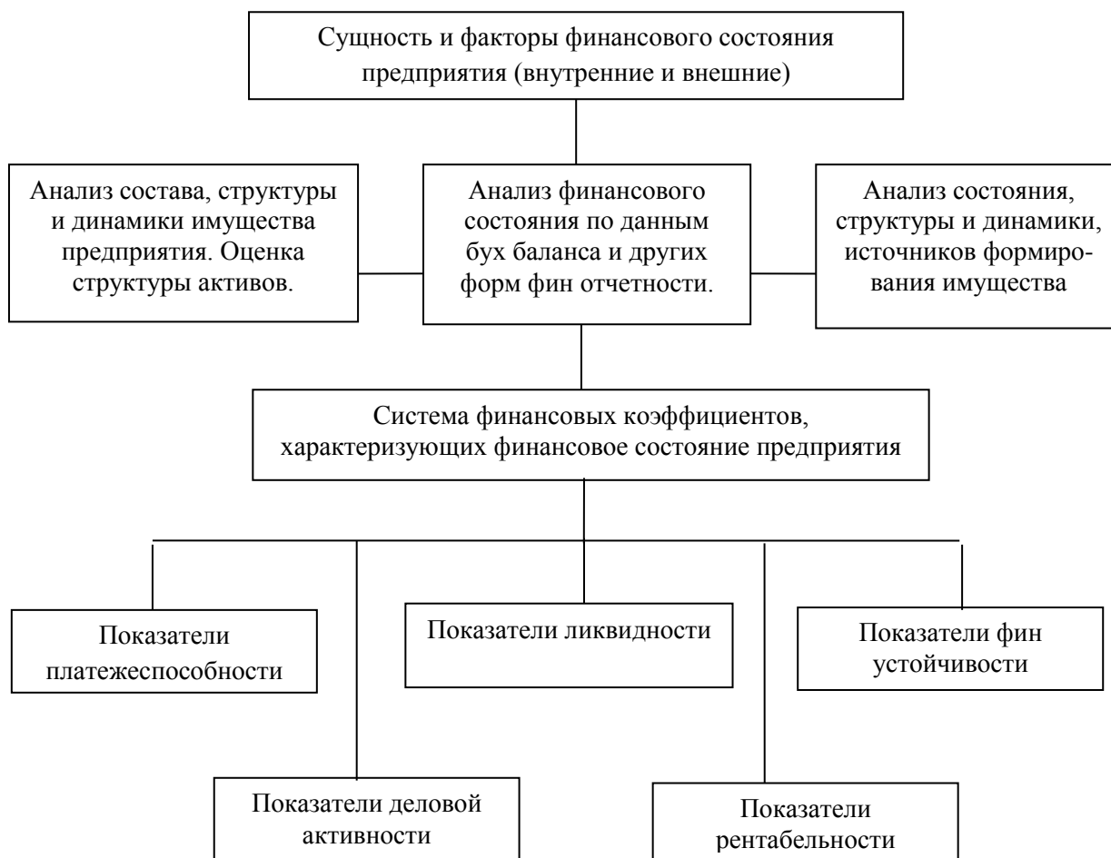
Рисунок 1 - Схема исследования финансового состояния организации

Основные этапы анализа финансового состояния исследуемой организации представлены на рисунке 1.