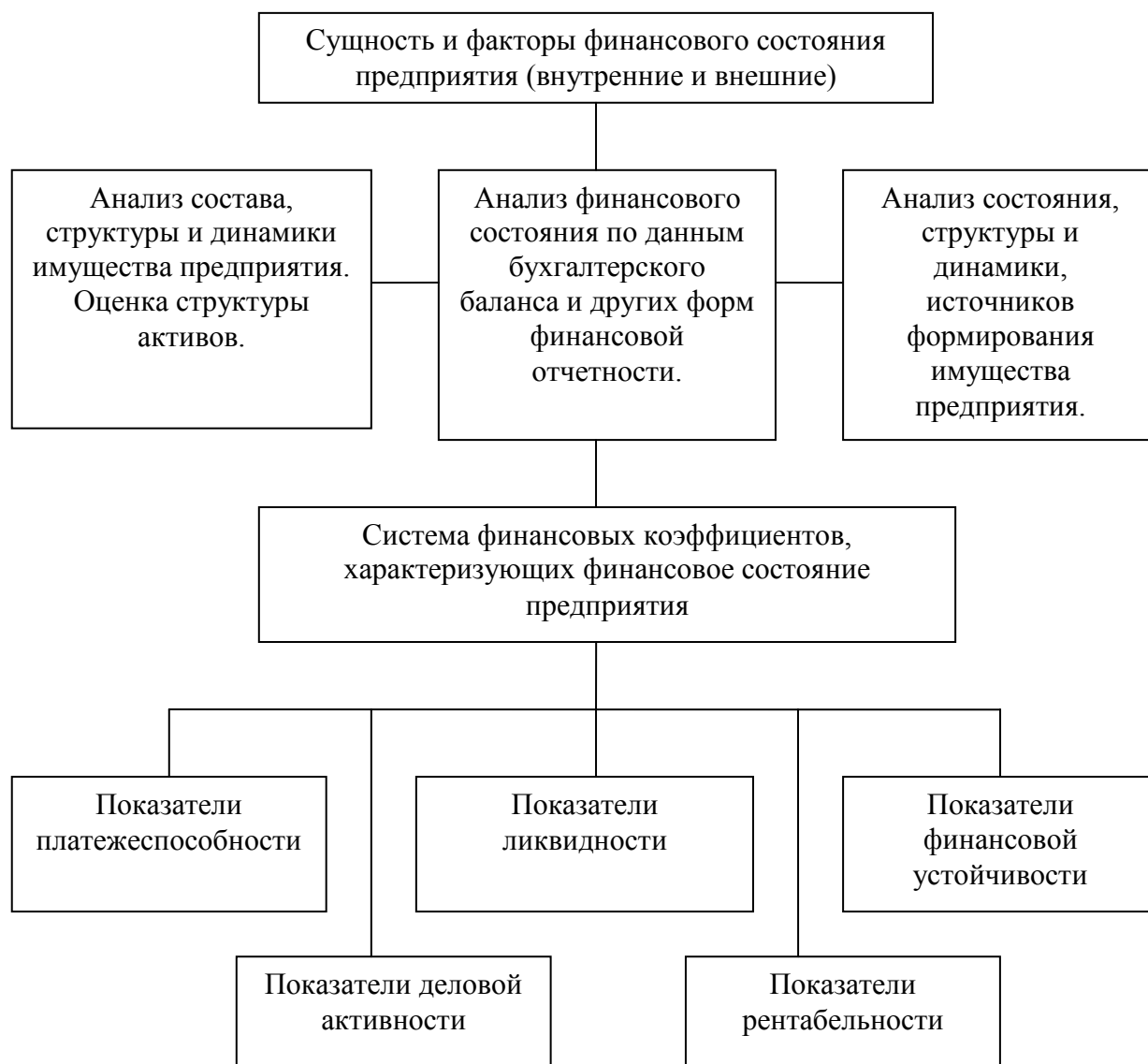
Рисунок 1 - Схема исследования финансового состояния организации

Основные этапы анализа финансового состояния исследуемой организации представлены на рисунке 1.