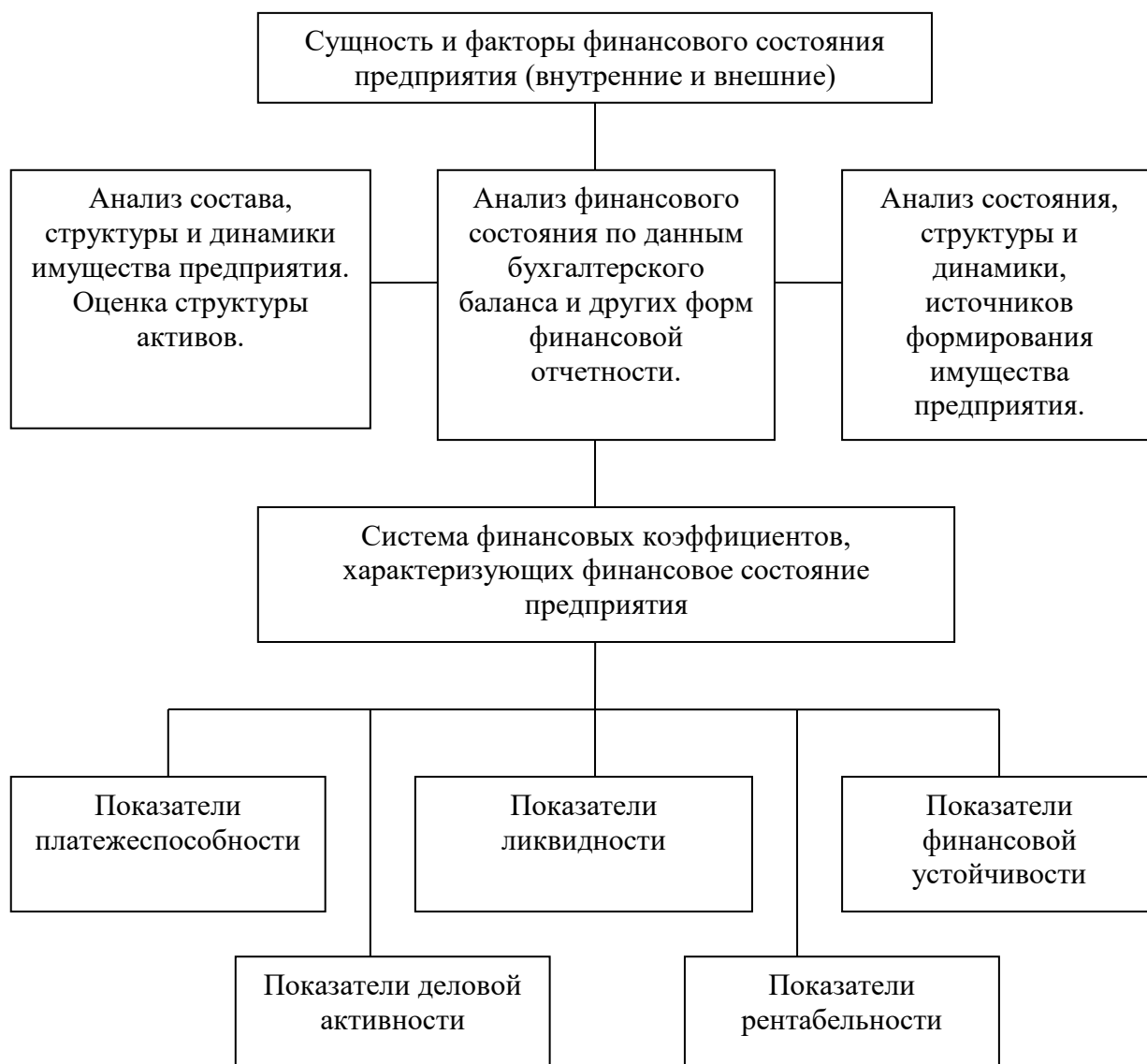
Рисунок 1 - Схема исследования финансового состояния организации

Основные этапы анализа финансового состояния исследуемой организации представлены на рисунке 1.