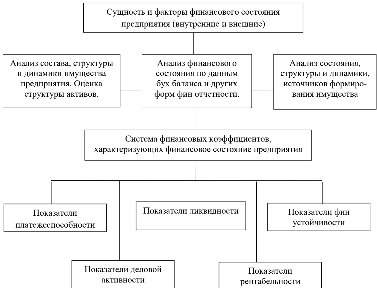
Рисунок 1 - Схема исследования финансового состояния организации

Формулы выносятся в отдельную строку. Формулы, на которые делаются ссылки в тексте, нумеруются цифрами в круглых скобках, размещаемых справа от формулы.