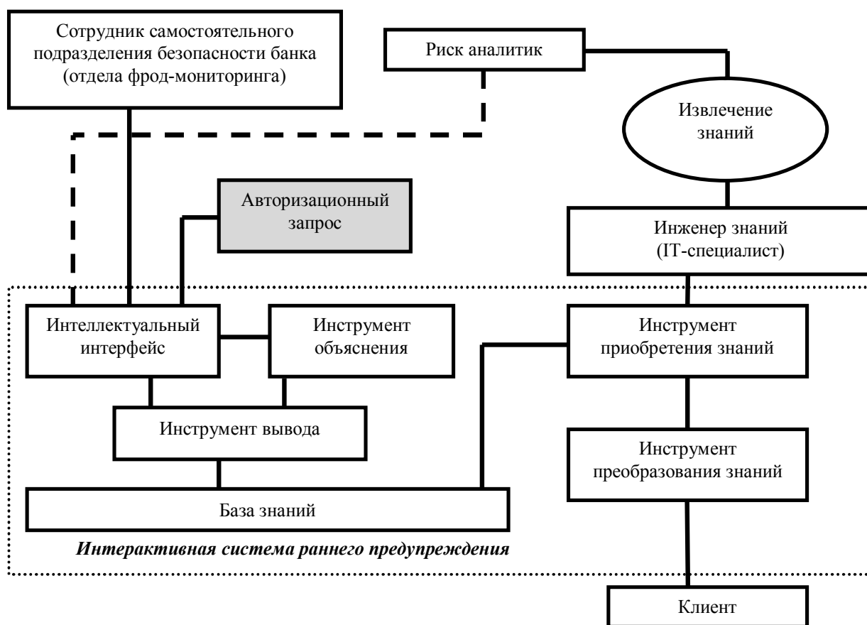
Рисунок 2– Структура интерактивной системы раннего предупреждения мошенничества с использованием банковских карт

Структура разработанной автором системы раннего предупреждения мошенничества представлена на рис. 2.